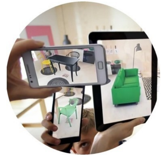
Visualisation en 3D d'objets, de meubles dans une maison comme s'ils y étaient ... (Aide à la décision d'achat)

On appelle réalité augmentée l'affichage d'informations (2D) ou d'images (3D) en superposition au monde réel sur les écrans de nos téléphones portables, tablettes, lunettes spéciales ou parebrises de voiture.