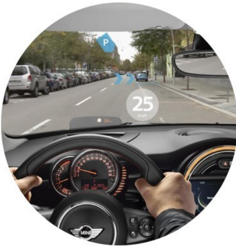
Affichage d'informations routières (Aide à la conduite).

Avec la réalité augmentée, le monde réel et le monde virtuel s'entremêlent en temps réel. La technologie insère des images de synthèse (en 2D ou 3D) au monde réel sur l'écran de nos appareils numériques.